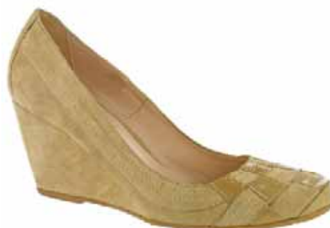
Art.: 723-2096 • Taglia: 41 - 42 Scarpa con zeppa in camoscio e fondo gomma, zeppa 70 € 69,00