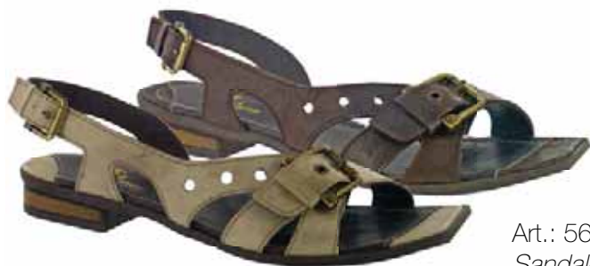
Art.: 564-2355 / 564-4355 • Taglia: 41 - 42 Sandalo in pelle gusto sportivo