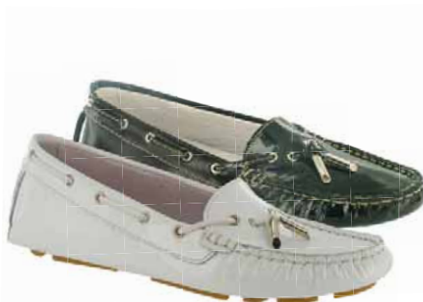
Art.: 518-1543 / 518-6543 • Taglia: 41 - 42 Mocassino driver in vernice € 59,00