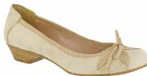
Art.: 624-2069 • Taglia: 41 - 42 - 43 Scarpa in pelle con inserti in pelle stampata tacco 30 € 59,00