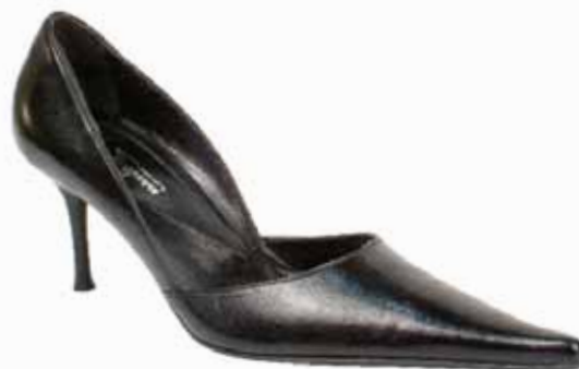
Art.: 724-0624 • Taglia: 41 - 42 - 43 Decollette con tacco 70 € 69,00