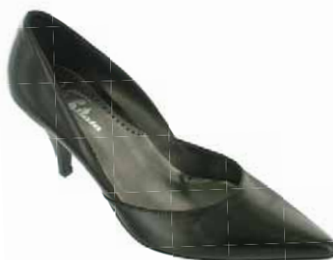
Art.: 724-6168 • Taglia: 41 - 42 Decollette con tacco 70 € 69,00