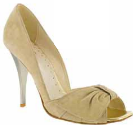
Art.: 723-2327 • Taglia: 41 - 42 Spuntata in camoscio con fiocco laterale, tacco 100 € 69,00