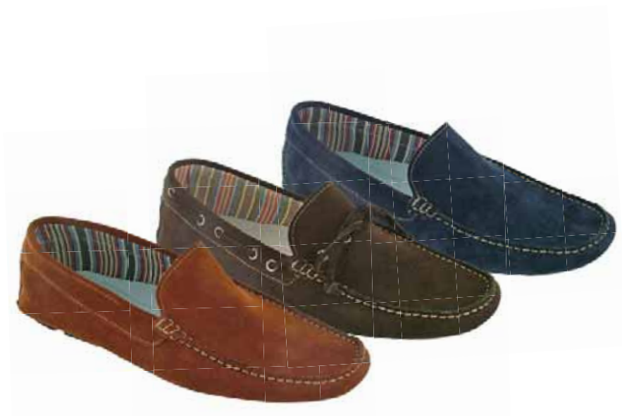
Art.: 843-3069 / 843-4068 / 843-9068 • Taglia: 46 - 47 - 48 Driver camoscio € 59,00