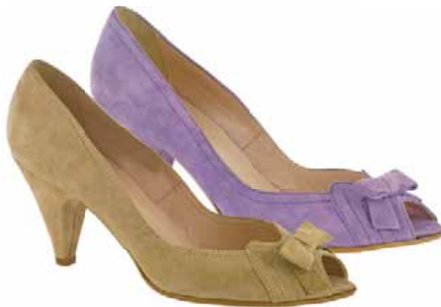
Art.: 723-2065 / 723-9065 • Taglia: 41 - 42 Spuntata in camoscio con fiocchetto, tacco 70 € 65,00