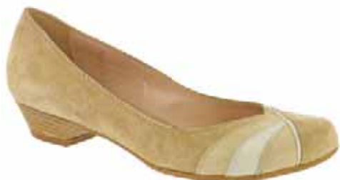
Art.: 623-2067 • Taglia: 41 - 42 - 43 Scarpa in camoscio tacco 30 € 59,00