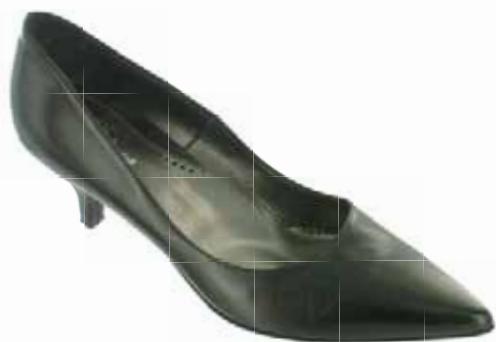
Art.: 624-6169 • Taglia: 41 - 42 Decollette con tacco 50 € 59,00