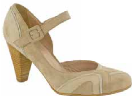
Art.: 723-2217 • Taglia: 41 - 42 Scarpa in camoscio con cinturino, tacco 70 € 69,00