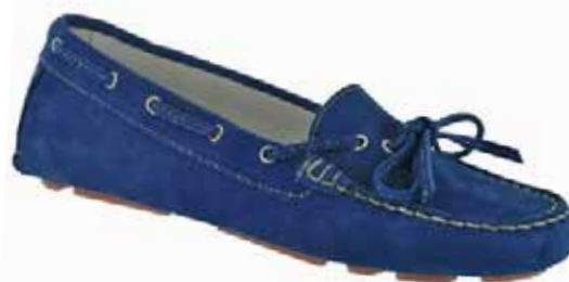
Art.: 516-9409 • Taglia: 41 - 42 Mocassino driver in nubuck € 59,00