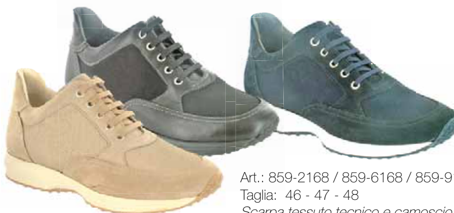
Art.: 859-2168 / 859-6168 / 859-9168 Taglia: 46 - 47 - 48 Scarpa tessuto tecnico e camoscio € 75,00