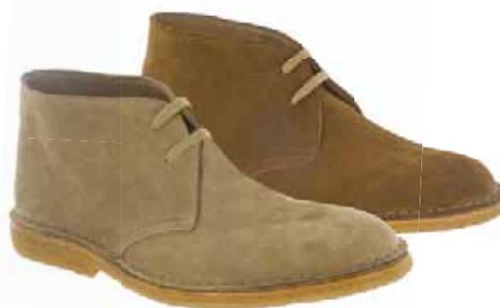
Art.: 853-3275 / 853-4275 • Taglia: 46 - 47 - 48 Polacco in camoscio € 59,00