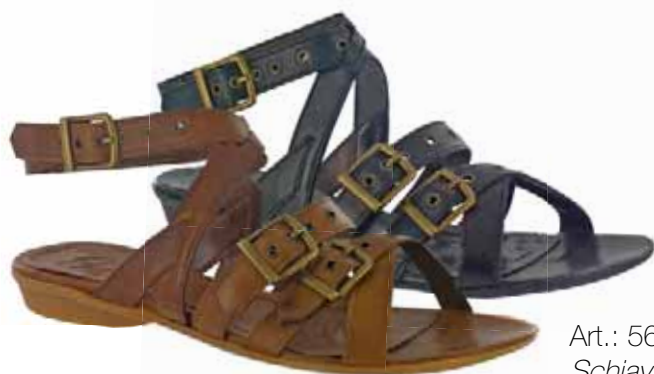
Art.: 564-4157 / 564-6157 • Taglia: 41 - 42 Schiava in pelle