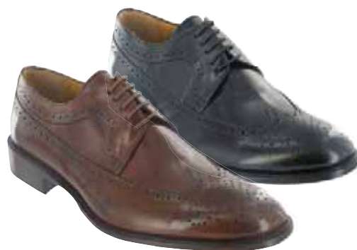
Art.: 834-3196 / 834-6196 Taglia: 46 - 47 - 48 ACQUASTATIC - Inglese in pelle € 95,00

BATA ACQUASTATIC Lo specifico sistema di costruzione permette lo scarico a terra dell'energia statica accumulata dal corpo.