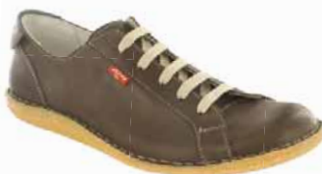
Art.: 854-4104 • Taglia: 46 - 47 - 48 LEVI'S bassa in pelle ingrassata € 85,00