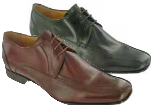
Art.: 834-4245 / 834-6245 Taglia: 46 - 47 - 48 ACQUASTATIC - Derby allacciato € 89,00