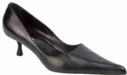
Art.: 624-0622 • Taglia: 41 - 42 - 43 Decollette con tacco 50 € 59,00