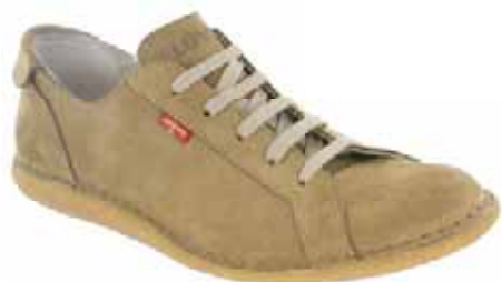
Art.: 853-2104 • Taglia: 46 - 47 - 48 LEVI'S bassa in camoscio € 85,00