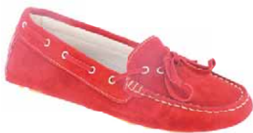
Art.: 513-5409 • Taglia: 41 - 42 Mocassino driver in camoscio € 59,00