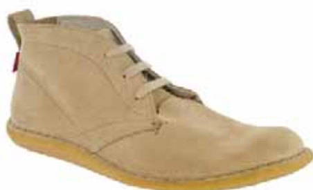
Art.: 853-1134 • Taglia: 46 - 47 - 48 LEVI'S polacco in camoscio € 89,00