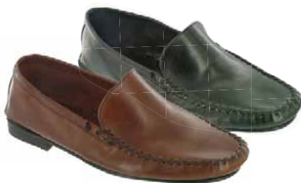
Art.: 844-0459 / 844-0659 • Taglia: 46 - 47 - 48 Driver pelle € 69,00