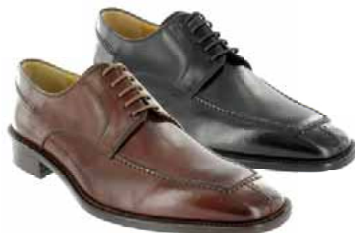
Art.: 834-2335 / 834-2635 Taglia: 46 - 47 - 48 Derby allacciato, fodera in vitello e fondo cuoio € 89,00