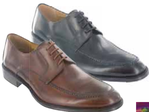
Art.: 834-3197 / 834-6197 • Taglia: 46 - 47 - 48 ACQUASTATIC - Classica stringata in pelle € 95,00