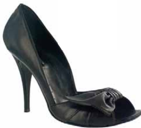
Art.: 724-6327 • Taglia: 41 - 42 Spuntata in pelle con fiocco laterale, tacco 100 € 69,00