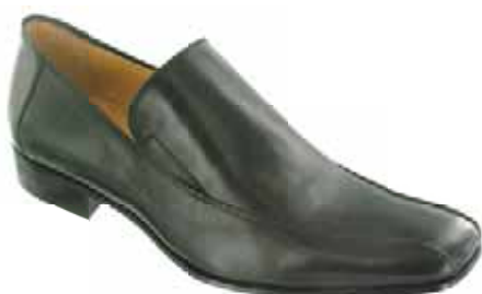
Art.: 824-6243 • Taglia: 46 - 47 - 48 ACQUASTATIC - Mocassino € 89,00